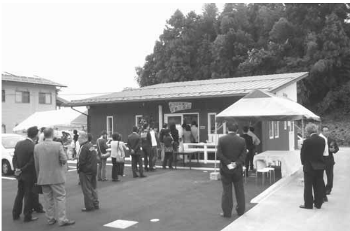
10/7 オープンセレモニー