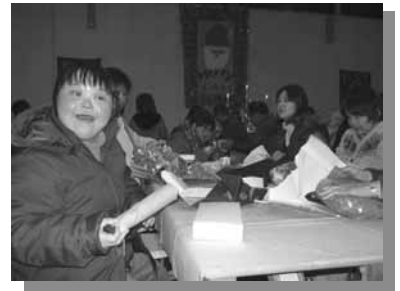
プレゼント何かかな？