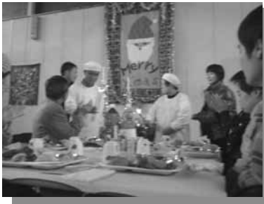
キャンドルサービス