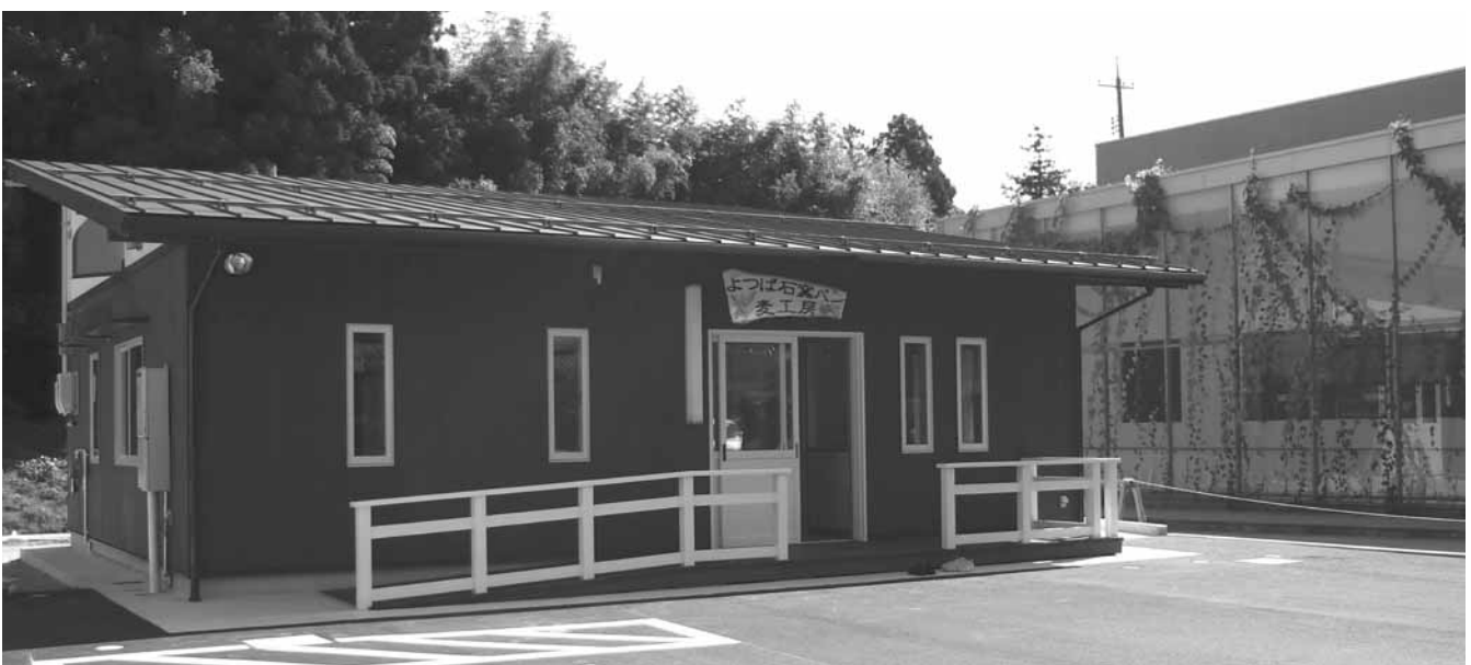
麦 工 房

年授産センターよつばも参加させていただいている「湖北ふれあい感謝祭」も中止となりました。 残念ではありますが、「利用者の方の健康管理」はもとより「万が一にも集団感染の場になつてはいけない」との思いからですので、ご理解をいただきたいと思います。 さて、既に折込みチラシ等でご存じの方もいらっしゃるかと思いますが、多機能型事業所ですが、