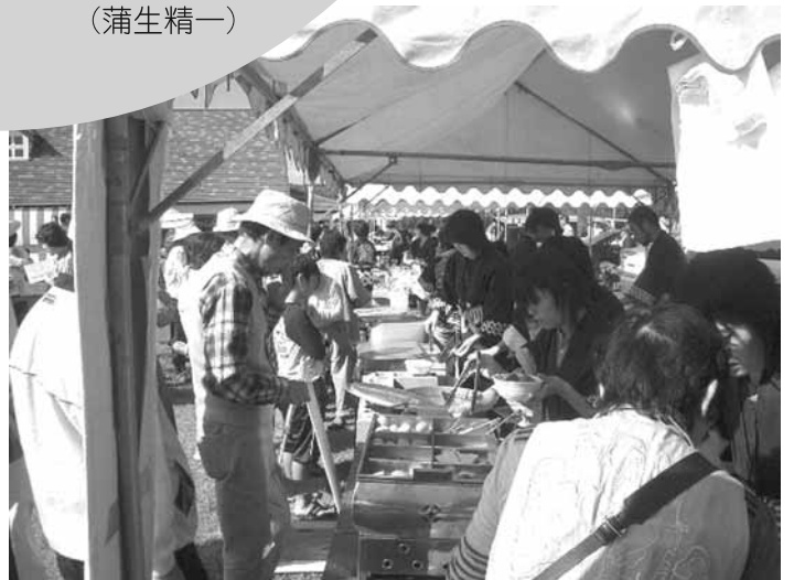
焼そば、おでん 大人気でした!