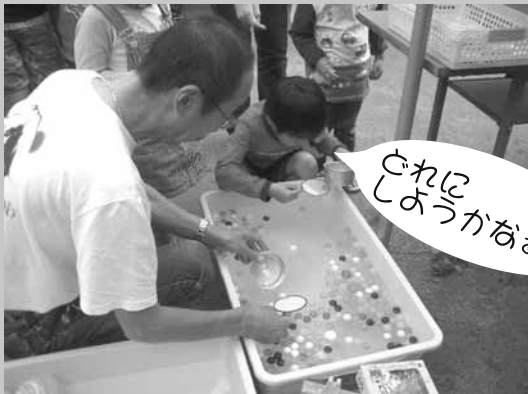
これにしようかなあ？