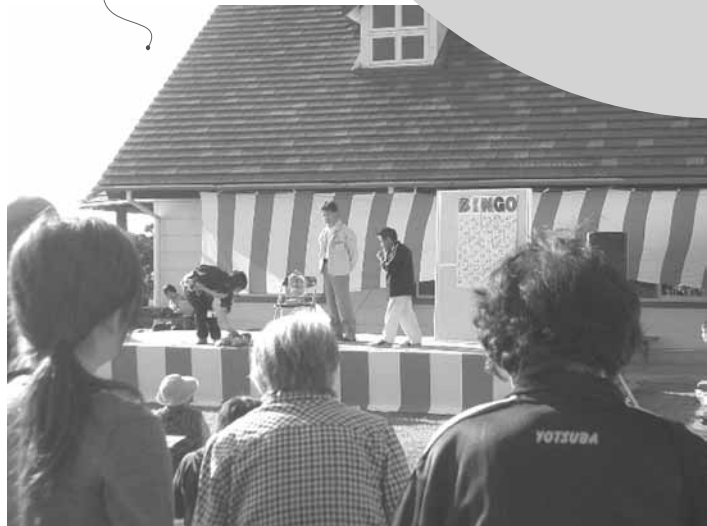
ビンゴ～!! 野菜が当たったよ