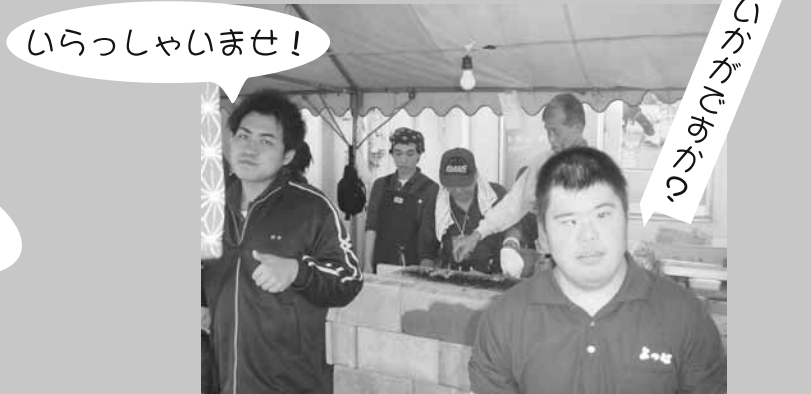
いらっしゃいませ！