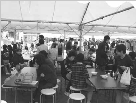
たくさんの方に ご来場いただきました