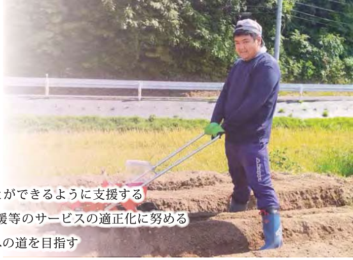
(写真) アクティブ'99 農耕班