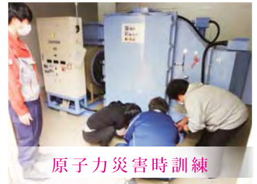
原子力災害時訓練

四ッ葉園で特に力を入れている本研修は研修のみならず、日々の虐待関連の報道へも常に目を光らせており、各事業所へ随時発信しています。