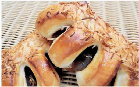
渋皮マロンデニッシュ 170円 渋皮栗を使った餡を使い、中には大粒の 渋皮栗がゴロっと入った一品★