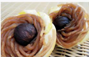
渋皮モンブラン 160円 香り高いイタリヤ産マロンペーストを使った生地に 渋皮栗餡をモンブランのように仕上げた一品