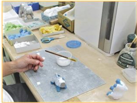
① 下張り作業 型に和紙を重ね貼りする