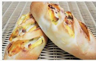
かほチーズ 170円 自家製かほちや餡と濃厚なクリームチーズを 合わせた枚にぴったりな新作パン