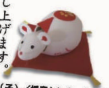
千支張り子(子) / 授産センターよつば

新春のお慶びを申し上げます。 常日頃より当福社会に格別のご配慮を賜り厚く御礼を申し上げます。 元号が変わって初めての新年を迎えました。 台風や大雨・地震などの自然災害が頻発した令和元年でした。まだ 関係者の皆様にあられたためお見舞い申し上げます。被災各地の 皆様、今年も十二支の「子年」にあたり、「増える」という意味合い があるそうです。草木の生命をはじめとした命が次々と誕生しようと するおめでたい意味もあります。 この新しい年が、その意味通りに、より佳き年になりますよう心より祈 念いたします。 本年もどうぞよろしくお願いいたします。